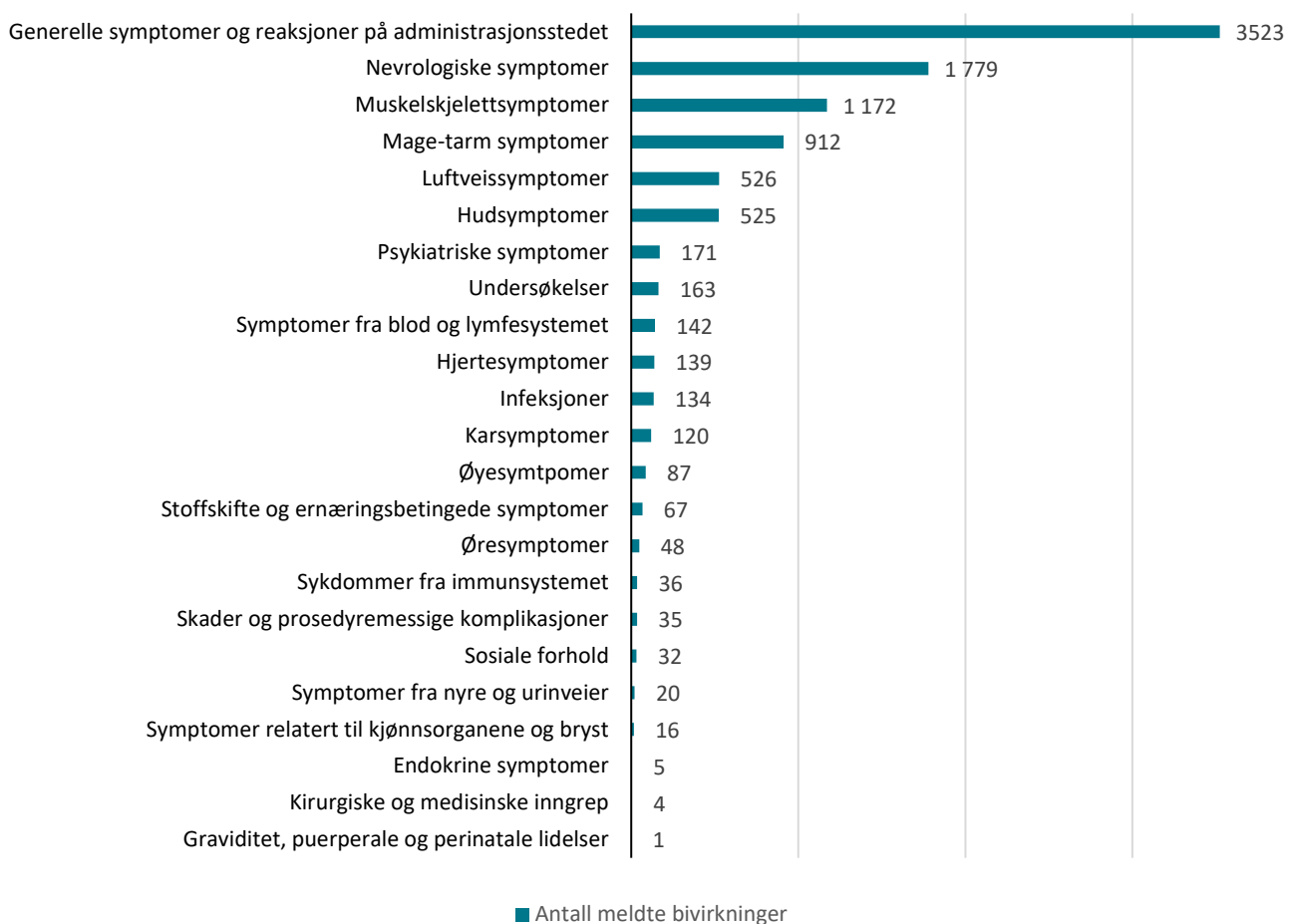
Figur 1: Meldte mistenkte bivirkninger fordelt etter kategori for mRNA-vaksiner (Comirnaty og COVID-19 Vaccine Moderna)