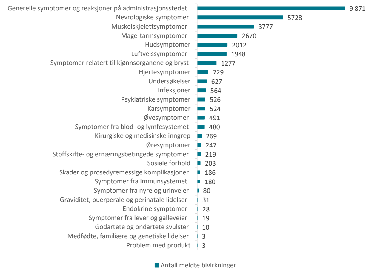
Tabell 6: Meldte mistenkte bivirkninger fordelt etter kategori for Comirnaty og Spikevax

En melding kan inneholde flere bivirkninger og dermed er det langt flere bivirkninger enn meldinger.