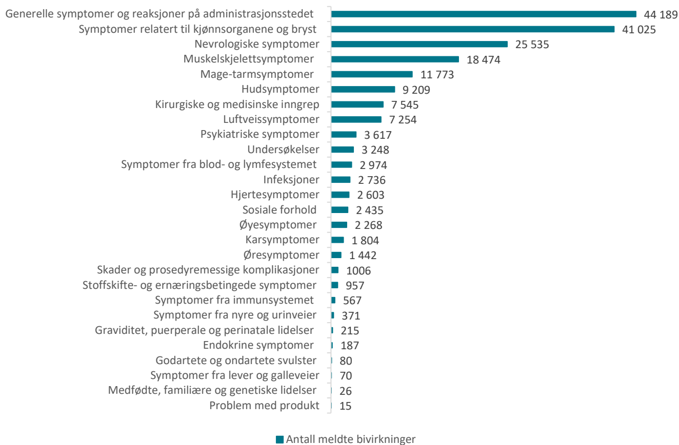
Tabell 7: Meldte mistenkte bivirkninger fordelt etter kategori for Comirnaty og Spikevax

En melding kan inneholde flere bivirkninger og dermed er det langt flere bivirkninger enn meldinger.